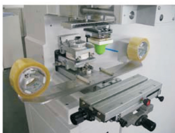
Automatsko čišćenje tampona