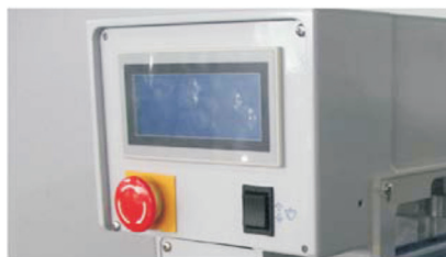
Kontrolni panel koji se aktivira na dodir